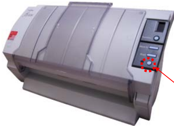
電源スイッチ (電源はパソコンと接続後に入れます)